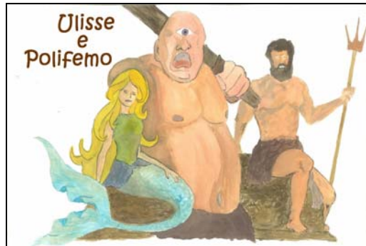
Portada de Ulises y Polifemo 3