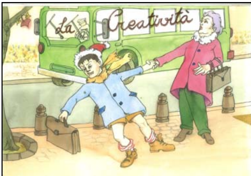
Portada de La creatività 2