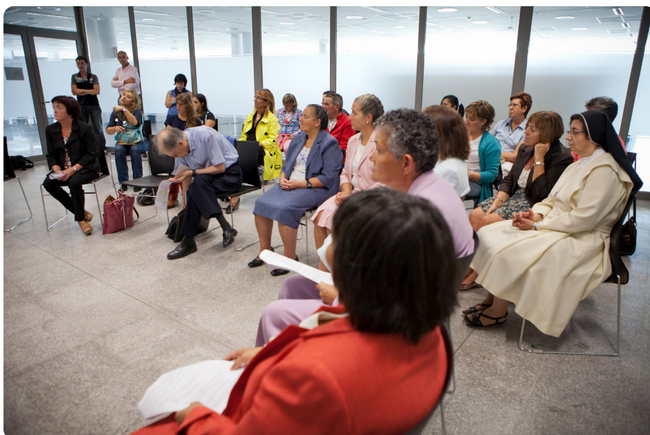
Sesión inaugural del Club de lectura fácil de Pamplona. Varias personas sentadas en semicírculo.

El Club de lectura fácil de Pamplona es una iniciativa donde nos juntamos una vez al mes con intención de disfrutar de la lectura.