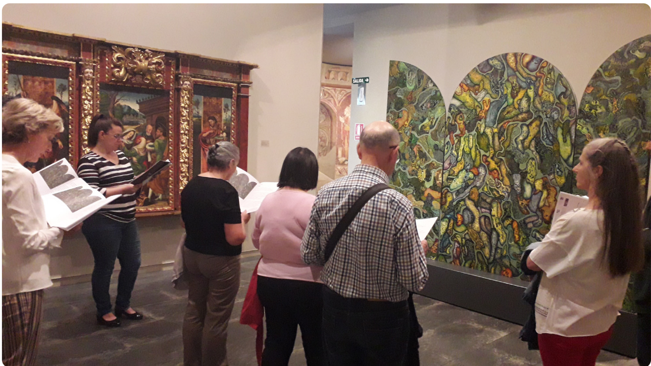
Grupo de personas frente a un cuadro en el Museo de Navarra.