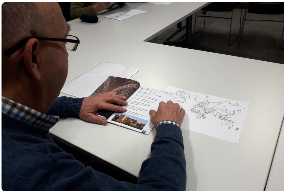
Sesión de lectura con mapa de ayuda.